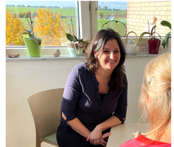
Mitarbeiterin im Bezugspflegegespräch

■ Wenn Sie nicht im Klinikum behandelt werden, sprechen Sie mit Ihrer behandelnden Ärztin oder Psychotherapeutin, die einen Einweisungsschein ausstellen kann. Wir bitten Sie, dann einen Termin für ein Vorgespräch in der PIA-Sprechstunde Psychosomatik (Kontakt siehe Rückseite) zu vereinbaren.