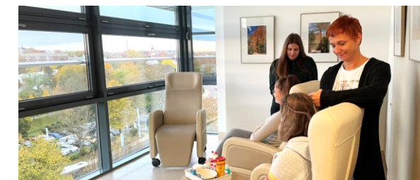
Mitarbeiterinnen des Pflegeteams während der Akupunktur

15 stationäre und 16 teilstationäre Therapieplätze