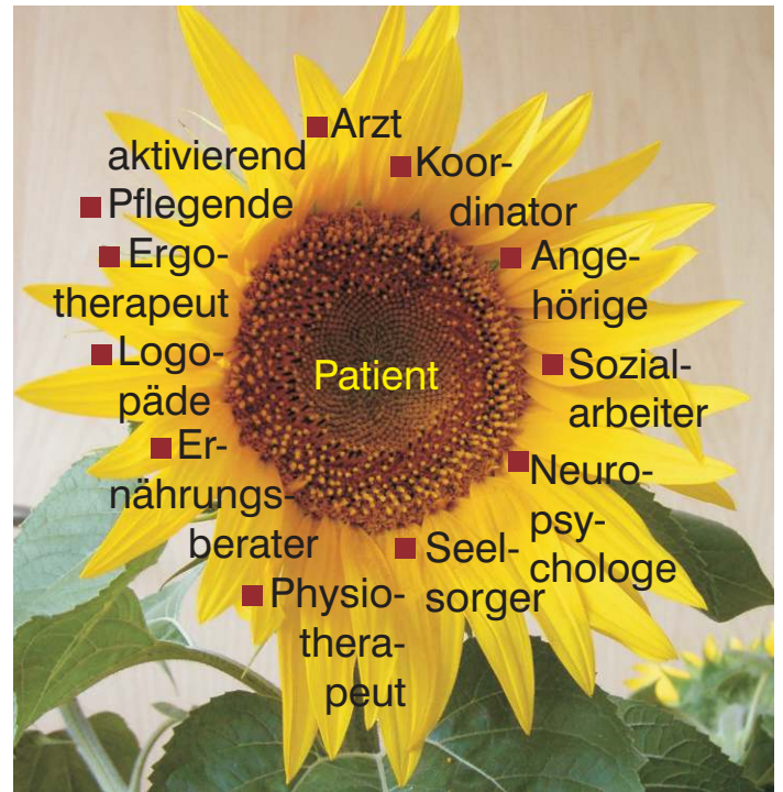
Die Professionen des therapeutischen Teams