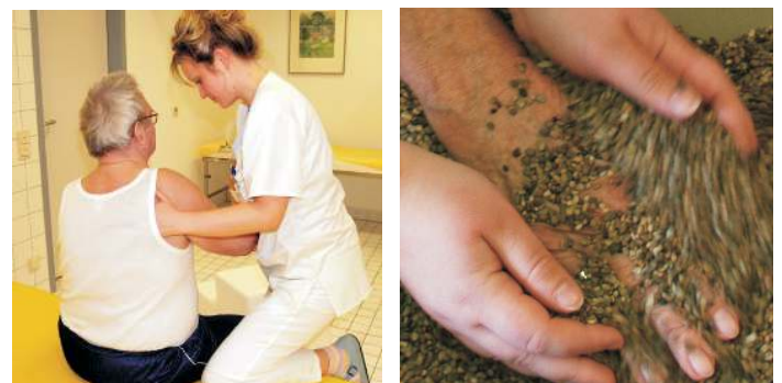
Ergotherapie auf der Bobathbank [linkes Bild] und im Kiesbad

Die Therapien erfolgen in der Regel montags bis freitags von 8:00 bis 15:00 Uhr.